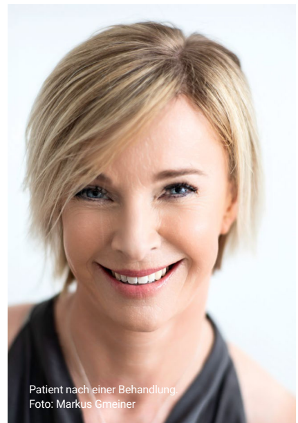
Patient nach einer Behandlung.