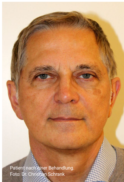
Patient nach einer Behandlung.

Ästhetik am Ammersee Seestrasse 43 82211 Herrsching am Ammersee +49815229150