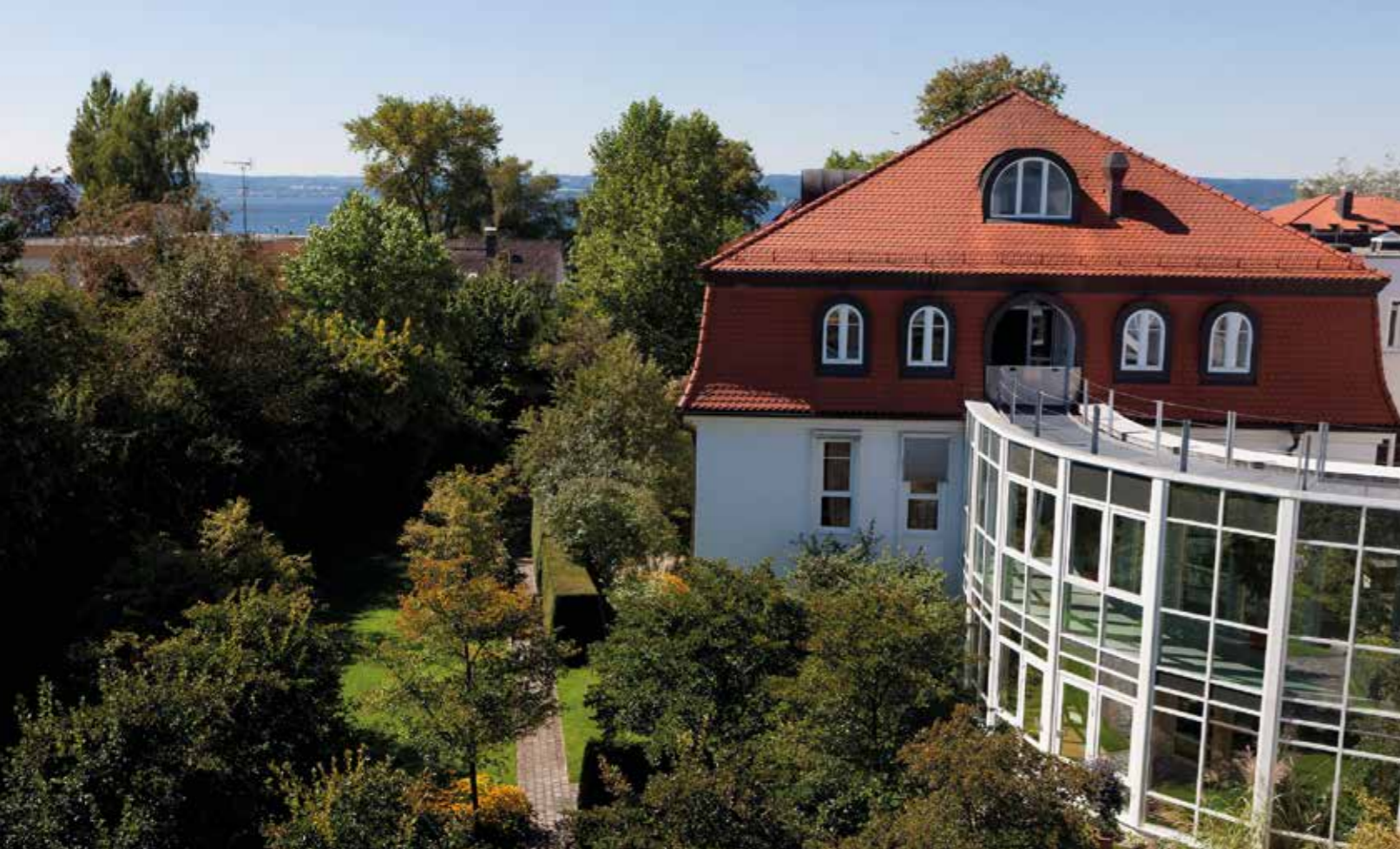
TEXT: MARILENA STRACKE