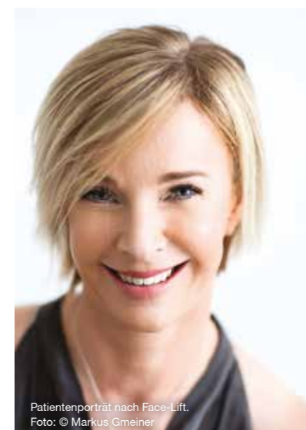
Patientenporträt nach Face-Lift.