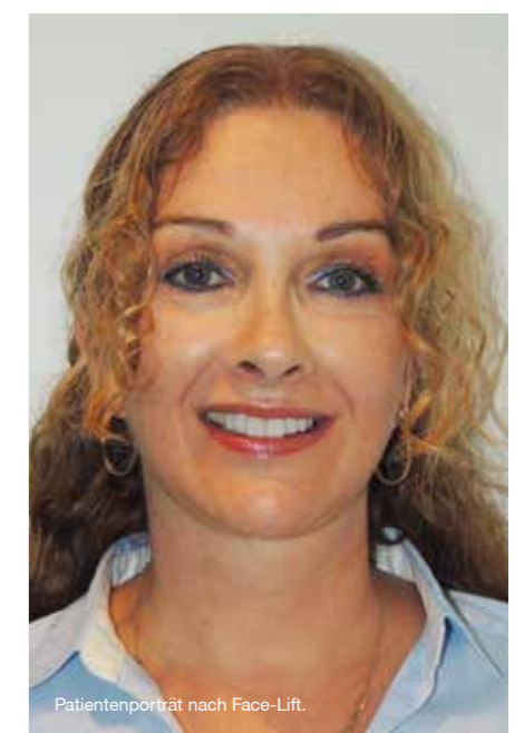
Patientenporträt nach Face-Lift.