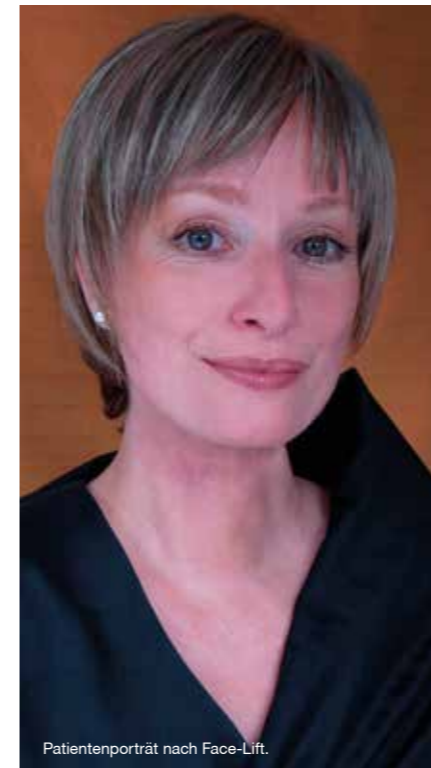
Patientenporträt nach Face-Lift.

Die Chirurgen erklären, dass dabei eben auch die Augenbrauen absacken und sich in dem Moment ein Pseudohautüberschuß im Oberlidbereich vorschiebt. Dieser wird häufig fälschlicherweise mit einer Oberlidstraffung