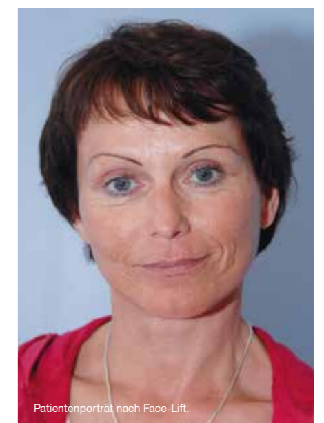
Patientenporträt nach Face-Lift.