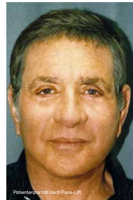
Patientenporträt nach Face-Lift.