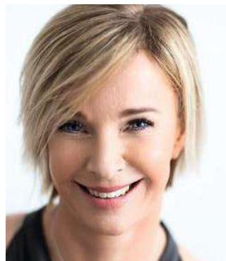
Patientenportrait nach Facelift