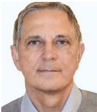
Patientenportrait nach Facelift

Seestraße 43, 82211 Herrsching Tel. 08152 2 91 50 www.dr-schrank.de info@dr-schrank.de